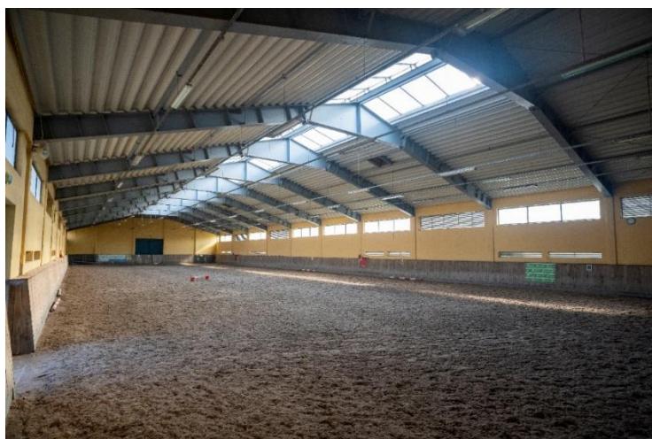
Hala treningowa (rozprężalnia) 60 m x 20 m